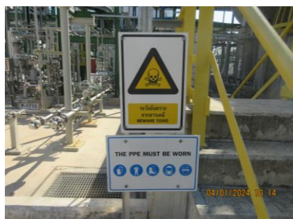
ภาพที่ 2-16 ป้ายเตือนพื้นที่ที่มีระดับเสียงเกินกว่า 85 เดซิเบลเอ