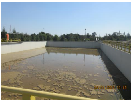
ภาพที่ 2-5 บ่อหน่วงน้ำฝน