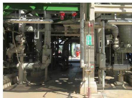
ภาพที่ 2-19 จุดชำระล้างร่างกายและล้างตาฉุกเฉิน