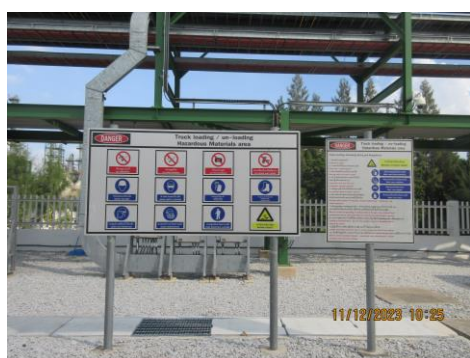
ภาพที่ 2-15 ป้ายเตือนให้สวมใส่อุปกรณ์ PPE