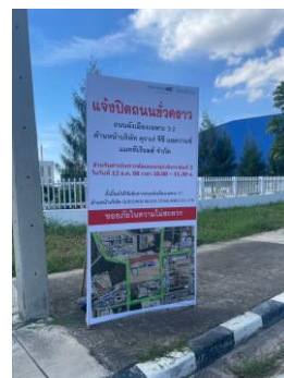
ภาพที่ 2-14 การประชาสัมพันธ์กับชุมชนใกล้เคียง