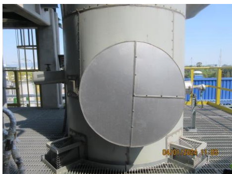
ภาพที่ 2-1 ระบบกำจัดฟอร์มัลดีไฮด์