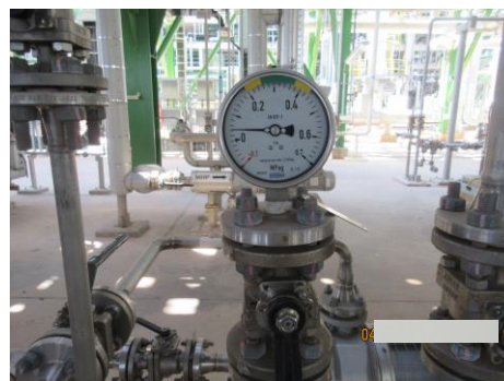
ภาพที่ 2-21 อุปกรณ์วัดอุณหภูมิและความดัน