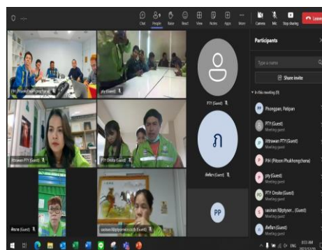
ภาพที่ 2-23 การอบรมเกี่ยวกับกฎระเบียบด้านความปลอดภัยอาชีวอนามัย และสิ่งแวดล้อม