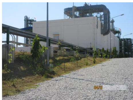
ภาพที่ 2-26 พื้นที่สีเขียวของโครงการ