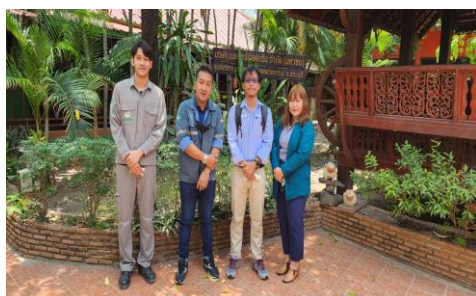
ภาพที่ 2-12 การติดตามตรวจสอบ (Audit) วิธีการจัดการของเสีย