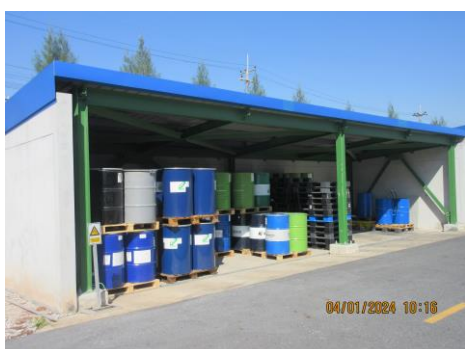
ภาพที่ 2-10 พื้นที่เก็บของเสียที่มีหลังคาปกคลุม