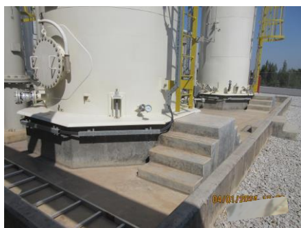
ภาพที่ 2-18 คันกั้นล้อมรอบลานถังเก็บกาก