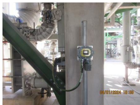
ภาพที่ 2-2 Gas Detector