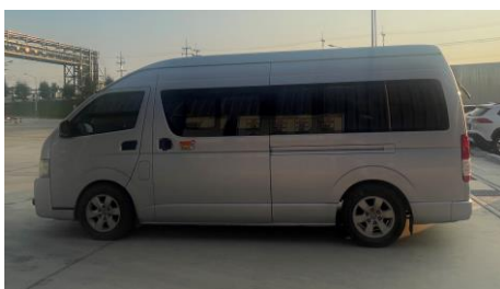
ภาพที่ 2-8 รถรับส่งพนักงาน