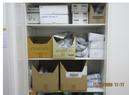
ภาพที่ 2-17 อุปกรณ์ป้องกัน PPE