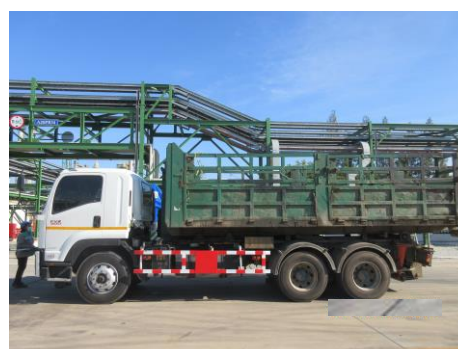
ภาพที่ 2-11 รถขนส่งกากของเสียอุตสาหกรรม