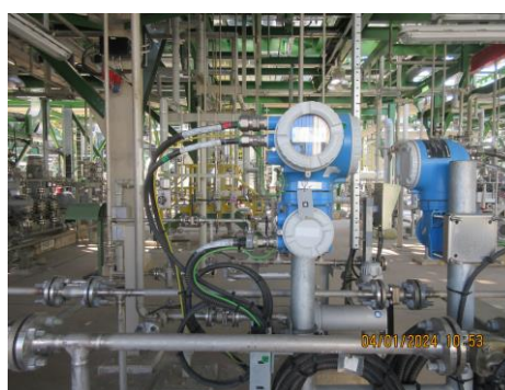
ภาพที่ 2-24 อุปกรณ์ตรวจวัดอัตราการไหล