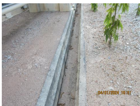
ภาพที่ 2-3 รังระบายน้ำ