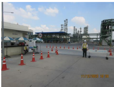
ภาพที่ 2-6 จุดตรวจบริเวณผ่านเข้า-ออกพื้นที่โครงการ