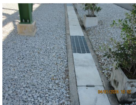
ภาพที่ 2-4 การทำความสะอาดรางระบายน้ำ