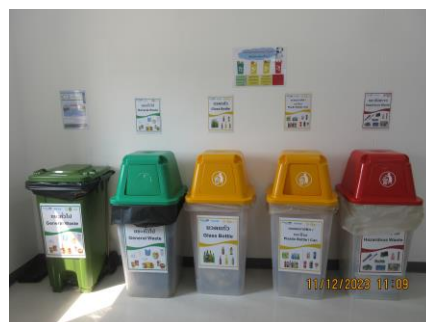
ภาพที่ 2-9 ถังรองรับขยะมูลฝอย