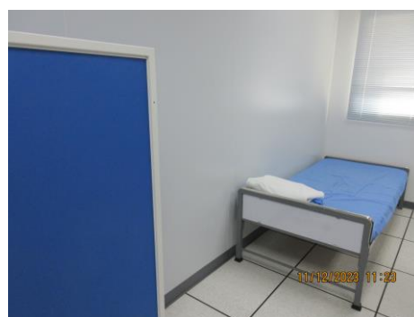
ภาพที่ 2-25 ห้องพยาบาลและเวชภัณฑ์พื้นฐาน