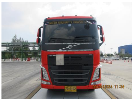
ภาพที่ 2-7 ติดเบอร์โทรศัพท์ ป้ายชื่อบริษัท รถขนส่งสารเคมี