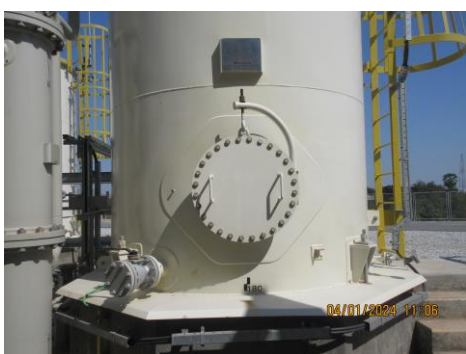
ภาพที่ 2-22 วาล์วฉวูกเงิน (Automatic Isolation Valve)